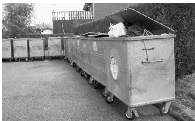
Irrésistible attrait de la proximité...