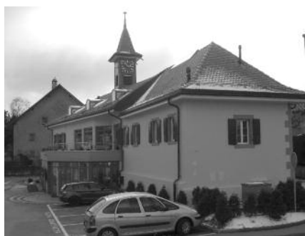
Maison de commune en Suisse, Mairie en France.