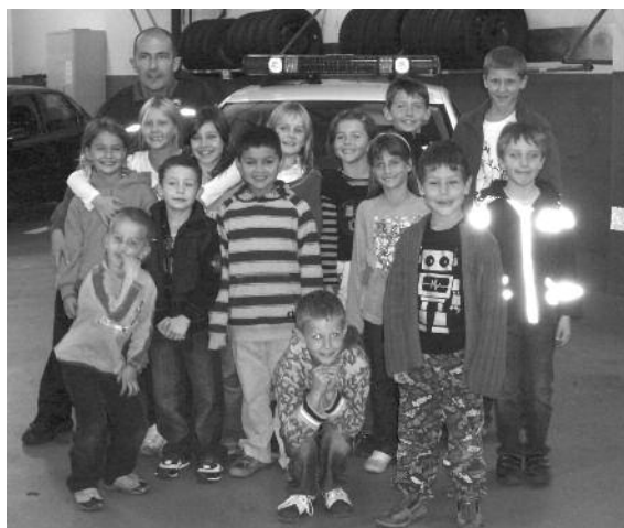
En visite à l'Hôtel de Police de Lausanne