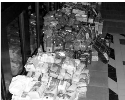
Marchandises récoltées en abondance

denrées (a priori, tout a bien été pris sauf les paillassons: aucune plainte ne nous est parvenue !!!)