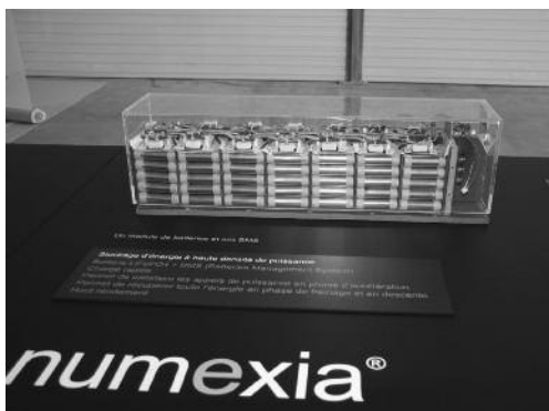
Le cœur du système, une unité de stockage d'énergie à haute densité.