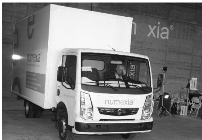
Le petit camion démarre vivement, mais en silence... et sans nuage noir!

électroniquement pour le stockage de l'énergie, ainsi qu'un transfert d'énergie du réseau au véhicule par induction (c'est-à-dire sans contact) au moyen de boucles magnétiques placées dans le sol, boucles dont le rendement optimal permet une recharge complète en 30 minutes, et enfin par la mise en œuvre d'un moteur synchrone à courant continu développant 100 kW conçu par Numexia et accouplé à la transmission. L'entreprise innove également en matière de commercialisation de ce concept, car elle fournira à l'utilisateur non plus un produit, mais un service intégral comprenant la location du véhicule, sa maintenance, l'assurance, l'assistance et l'énergie consommée pour un prix de revient kilométrique avantageux, comparé à celui parcouru en brûlant du diesel.