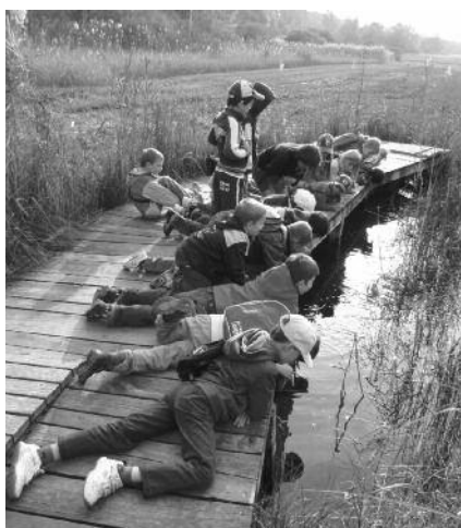
Nous avons aussi une sortie nature à Champ-Pittet «dans la peau d'une grenouille».

Une balade à dos d'âne au départ du collège a malheureusement dû être annulée en raison de la pluie.