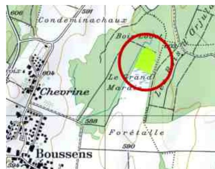
Emplacement du Grand Marais

Rapport, évolution des travaux et compléments d'information sont à consulter sur le site du village : www.Boussens.ch , rubrique Commune, onglet Le Grand Marais.