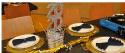
Nouvel An organisé par la Jeunesse

Toutes ces manifestations sont ouvertes aux Boussinois. Des informations complémentaires vous parviendront dans le courant de l'année.