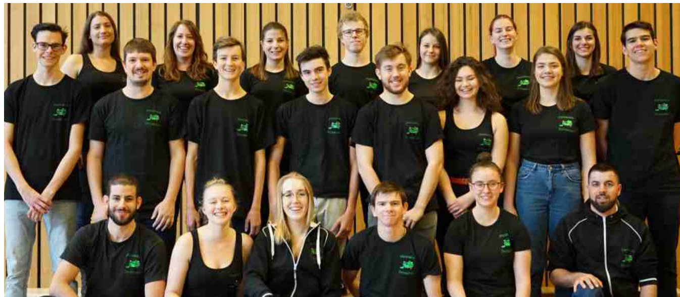
La Jeunesse de Boussens

Soirée annuelle du BEL vendredi 26 juin 2020