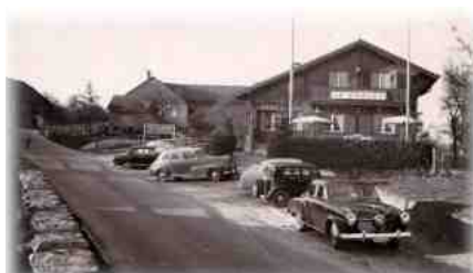
Restaurant le Chalet de Boussens en 1951

Texte paru dans le supplément « spécial 120 ans » du journal de Cossonay du 27 septembre 2019