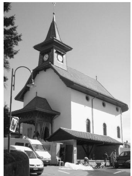
Ultimes travaux, la veille de l'inauguration.

L'après-midi, on pouvait assister à diverses animations et écouter un autre beau concert, de gospel celui-ci, par l'ensemble vocal FA 7. L.D.