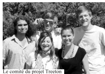
Le comité du projet Treeton