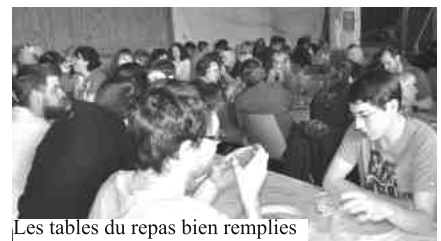
Les tables du repas bien remplies