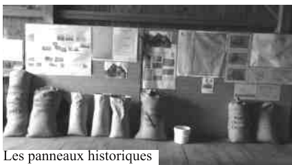
Les panneaux historiques