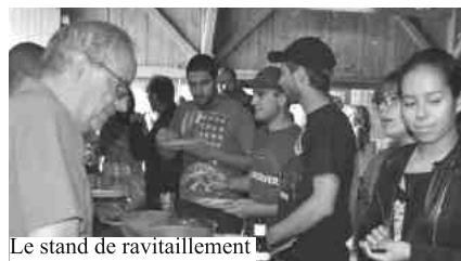
Le stand de ravitaillement