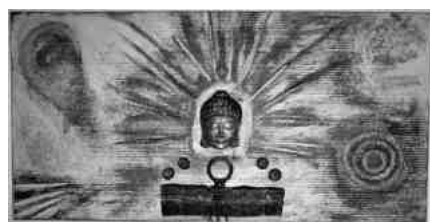
Tendresse - En powertex

En janvier 2017, Véronique organisera des cours de powertex. Des précisions suivront sur le site.