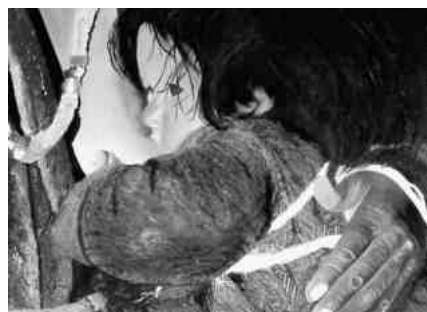
Enfant tibétain - Peinture à l'huile

Le powertex permet de réaliser des objets de décoration, statues, bijoux et existe en plusieurs coloris. Il est non toxique et peut être facilement utilisé par un enfant.