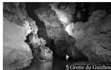
Grotte du Guizhou

Leur deuxième semaine se déroule dans le Guizhou où la rivière Shuanghe se fraye un passage au