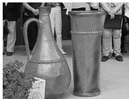
Jarre et pot en terre cuite prochainement exposés dans la maison de commune de Boussens.

Ensuite, pour le souper, deux cochons de lait nous ont été servis.