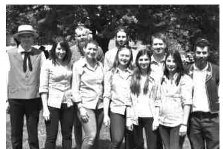
La Jeunesse de Boussens

sur www.nendazcordesalpes.ch et www.yverdon2018.ch N.M.