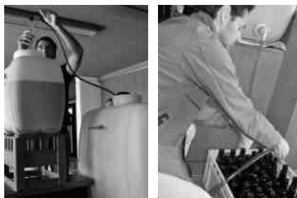
Transfert du breuvage dans une même grande cuve et mise en bouteille