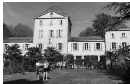
Maison patrimoniale de Boussan