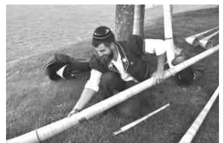
Montage d'un cor