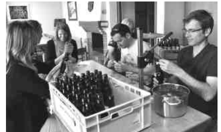
Encapsulage et étiquetage