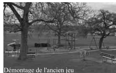
Démontage de l'ancien jeu