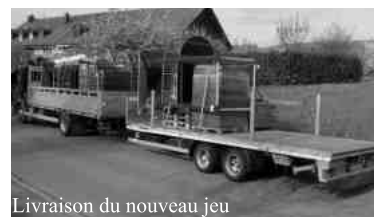
Livraison du nouveau jeu