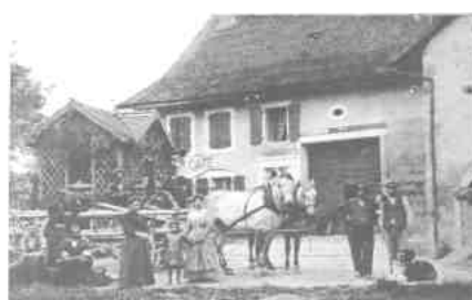
1909 : Café de l'Espérance