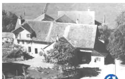
1965 : Le devant de la ferme