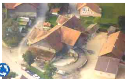
1999 : La ferme avant transformation