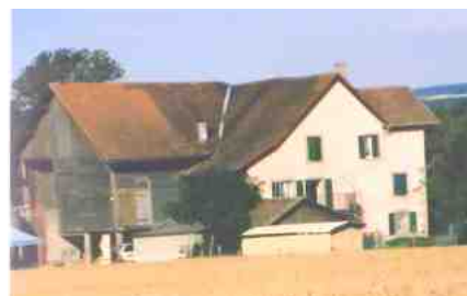
1987 : L'arrière de la ferme face sud