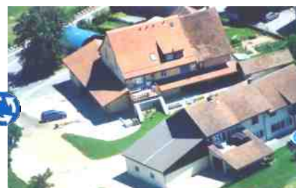
2001 : La ferme après transformation