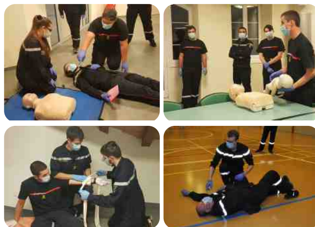
Exercices organisés le 24 mars 2021 à Boussens

Le recrutement se fait le 5 novembre cette année. Il faut être âgé d'au moins 18 ans et être domicilié dans la région.