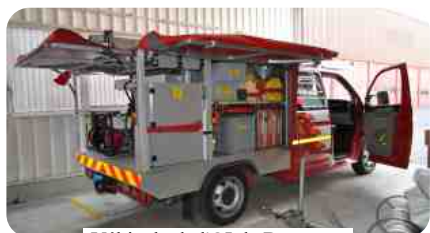
Véhicule de l'OI de Boussens

Dans le jargon des pompiers, ce groupe est nommé l'organe d'intervention (OI) de Boussens . Il est l'un des cinq détachements d'appui (DAP) qui dépendent du Service Défense Incendie et Secours (SDIS) de la Région Venoge, basé principalement à Penthelaz. Historiquement, cette région correspond aux contours de l'ancien district de Cossonay. Elle couvre 27 communes, de Mont-la-Ville à Boussens et de Pompaples à Vuflens-la-Ville, soit une surface de 12 400 hectares dans laquelle vivent 26 000 habitants.