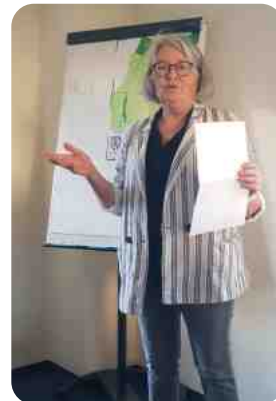
Mme Grivel lit le discours d'assermentation