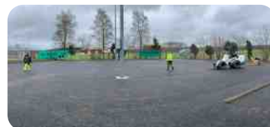
Les terrains le 10 mars 2023,