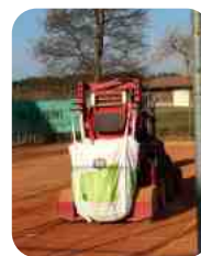
Début des travaux le 6 mars 2023 Décompactage des tapis remplis de sable.. Plus de 10 tonnes !

A votre disposition notre site tcboussens.ch . Nous nous réjouissons de vous rencontrer sur nos nouveaux terrains. Le comité du TC Boussens