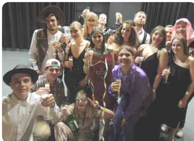
La Jeunesse au cours de notre soirée Boussiwood le 31 décembre 2022