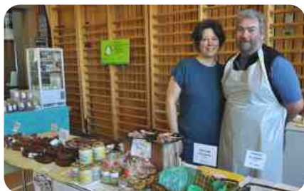
Boucherie Vuissoz de Bercher