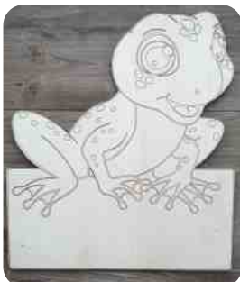
Panneau de naissance