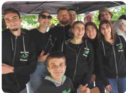
La Jeunesse de Boussens