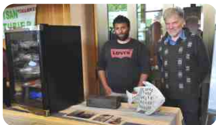
Pêcherie d'Allaman et leur frigo de poissons frais

Mais les visiteurs ont manqué à l'appel. «C'était une première, nous n'étions pas connus» concluent les organisatrices, non découragées. Elles lanceront probablement une nouvelle édition le printemps prochain. NM