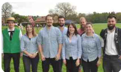
L'amicale des Anciens de la Jeunesse

Malheureusement la pluie s'invita dans le courant de l'après-midi et la remise des prix fut plus intime au foyer de la grande salle. NM