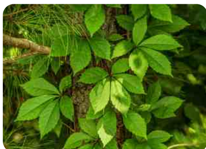
Vigne vierge à cinq folioles