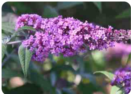
Buddleia ou arbre à papillon