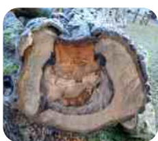
Etat des arbres abattus

Ces arbres seront remplacés dans les deux prochaines années.